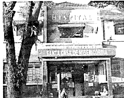
Santa Casa receberá porcentagem de venda de ingressos

O show de Renato Teixeira, Um Poeta e Um Violão, além de trazer música de qualidade para o público será solidário em prol da Santa Casa de Misericórdia de Santa Cruz do Rio Pardo. A cada ingresso uma porcentagem será revertida para o hospital.