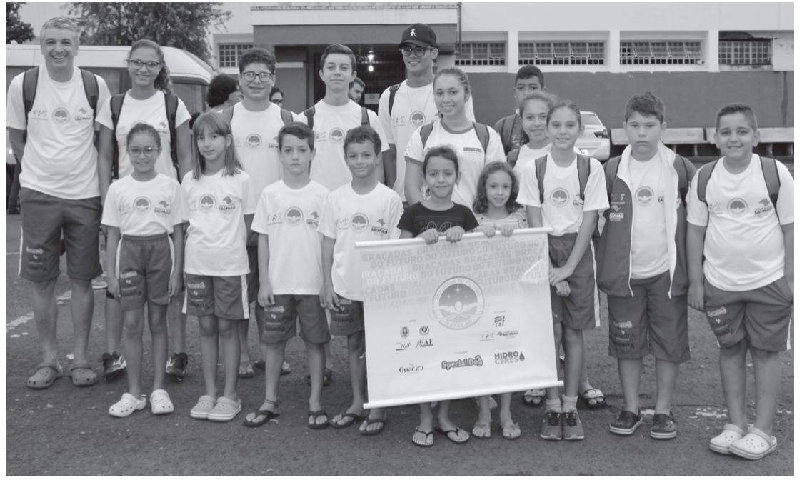
Equipe Afan\Projeto Braçadas do Futuro na primeira competição de 2019