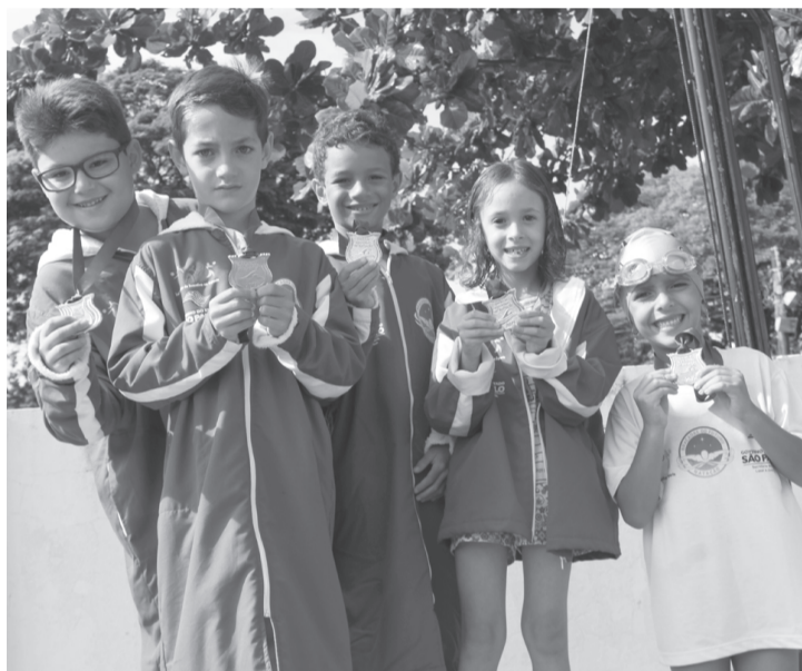
Alguns dos membros da equipe no pódio com suas medalhas