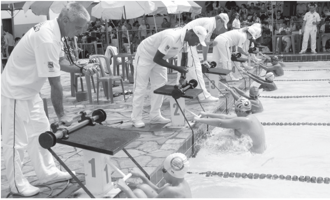
Atletas antes da queda na piscina para a prova